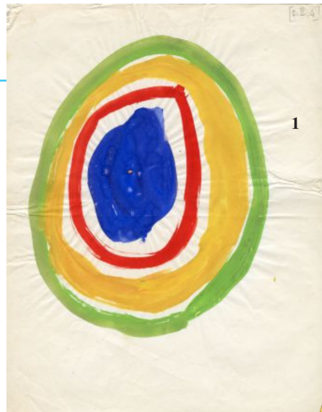
Nelle foto: 1- Amelia Rosselli, Senza titolo, s.d.; 2 - Enrico Baj, AntoniettuLiger, 1974; 3 - Gillo Dorfles, Immagini ambigue 1951; 4 - Luigi Ontani, Chirone et Achille, 1980; 5 - Eugenio Montale, II Ilobregat, 1954

Il noto poeta ha curato la mostra che celebra i primi cinquant'anni di vita della galleria d'arte diventata museo intessendo un singolare percorso espositivo nel tempo tra arte visiva e poesia